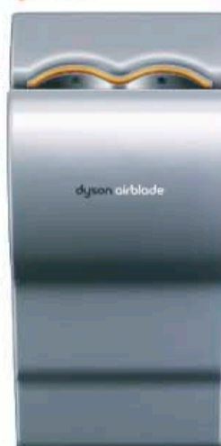
Airblade de Dyson.

Les mains sont sèches en 10 secondes. L'air sort d'une micro-fente et tombe en rideau à une vitesse de près de 640 km/h. L'appareil, équipé d'un filtre Hepa, pulse un air purifié à 99,9%. Sa surface est recouverte d'une pellicule antibactérienne qui réduit les risques de contamination croisée. L'atout écolo : grâce à la puissance de son moteur et à l'absence d'élément chauffant, il permet de réaliser jusqu'à 80% d'économies d'énergie. E. M.